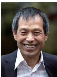
丸山和也（まるやま かずや） 参議院議員・弁護士

自由民主党政務調査会法務部会長、丸山総合法律事務所 代表。 兵庫県生まれ。1969年早稲田大学法学部卒業、上級職試験合格後法務省を経て、1970年に司法試験に合格。1976年4月渡米。ワシントン大学ロースクールを卒業、その後ロサンゼルス法律事務所にて3年間勤務。